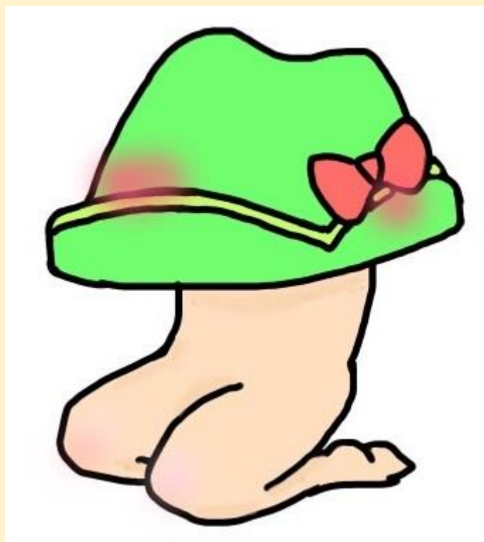
公式マスコットキャラクター:ガリバーハットくん(正座 ver.)